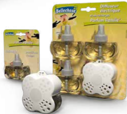
EMBALLAGE BLISTER AVEC 3 RECHARGES BLISTER PACK WITH 3 REFILLS