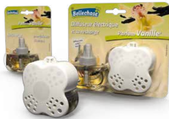
EMBALLAGE BLISTER BLISTER PACK